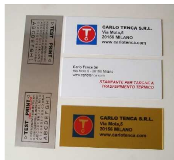
ALCUNI ESEMPI DI TARGHE